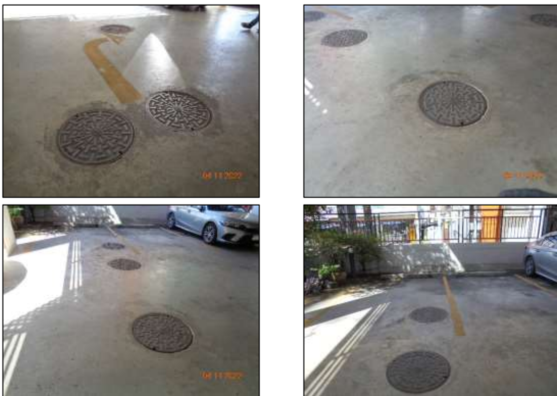
รูปที่ 1-5 ระบบบำบัดน้ำเสียสำเร็จรูป