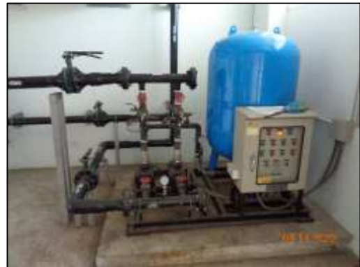
รูปที่ 1-4 ระบบปั้มน้ำของโครงการ