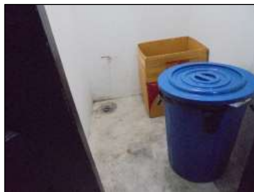
รูปที่ 1-7 ห้องพักขยะ