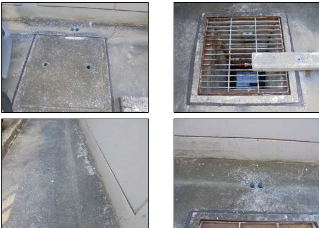
รูปที่ 1-6 ระบบระบายน้ำ

3) ระบบป้องกันน้ำท่วม ทางโครงการได้จัดสร้างบ่อหน่วงน้ำคอนกรีตเสริมเหล็กใต้ดินอยู่บริเวณใต้อาคาร เพื่อรองรับปริมาณน้ำฝนได้อย่างน้อย 3 ชั่วโมง โดยบ่อหน่วงน้ำมีขนาดกว้าง 4.5 เมตร ยาว 9.1 เมตร ระดับเก็บกักน้ำ 2.5 เมตร มีปริมาตรเก็บกักประมาณ 102 ลูกบาศก์เมตร สำหรับแบบแปลนและรูปตัดของบ่อหน่วงน้ำที่ทางโครงการจะได้ทำการยื่นขออนุญาตก่อสร้าง และเมื่อน้ำฝนสะสมในบ่อหน่วงน้ำเกินกว่าอัตราที่ทำการคำนวณไว้จะระบายออกจากบ่อหน่วงน้ำ ด้วยการสูบน้ำออกโดยใช้เครื่องสูบน้ำ ซึ่งมีความสามารถในการสูบน้ำไม่เกินกว่า 0.0051 ลูกบาศก์เมตร/วินาที