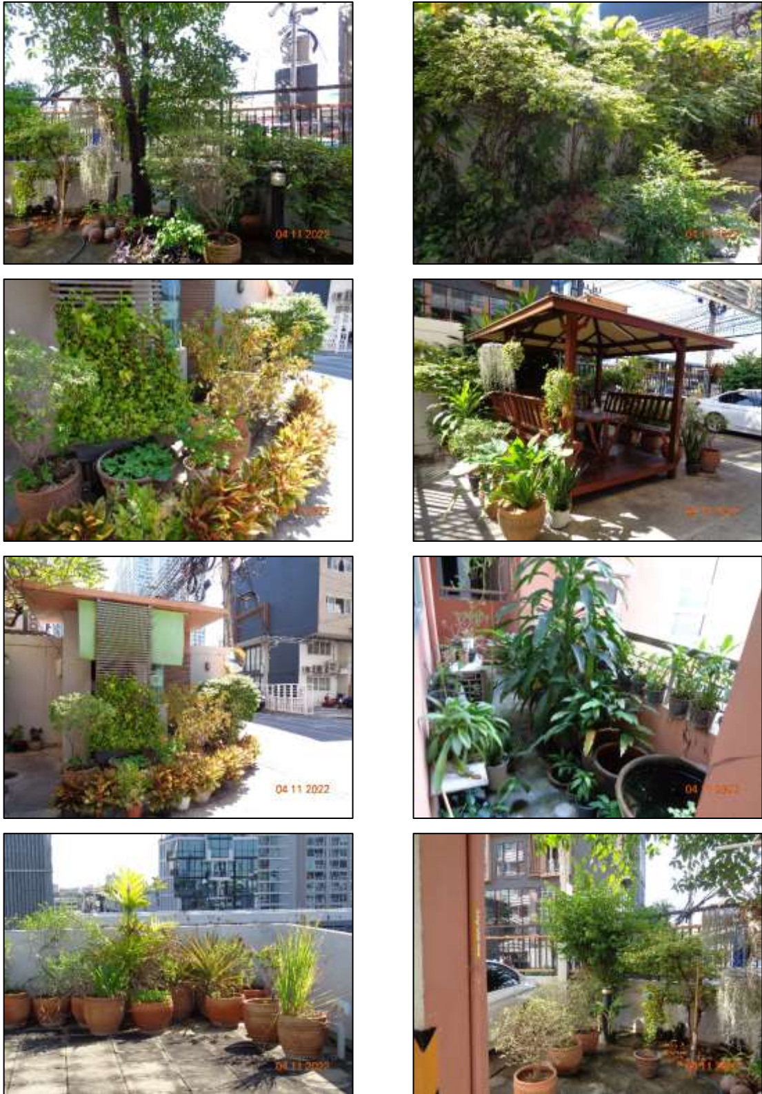
รูปที่ 1-2 พื้นที่สีเขียว และพื้นที่นันทนาการของโครงการ