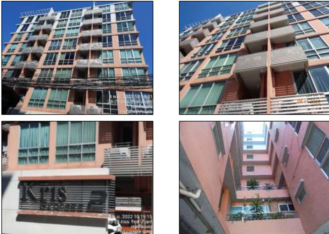
รูปที่ 1-3 สภาพปัจจุบันของโครงการ

ปัจจุบันโครงการอยู่ในช่วงเปิดดำเนินการ โดยโครงการได้รับใบรับรองการก่อสร้างอาคาร ดัดแปลงอาคาร หรือเคลื่อนย้ายอาคาร (อ.6) เรียบร้อยแล้ว ดังแสดงในภาคผนวก ก-3 และแสดง ในรูปที่ 1-3